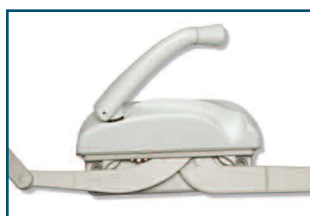
DECORE double bras dual arm