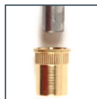
tige et gâche rod and keeper