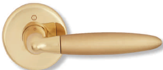
poignée passage droite passage right hand