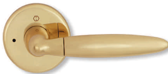
déverrouillage d'urgence emergency release