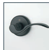
série Munchen Munchen series