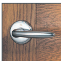
série Verona Verona series