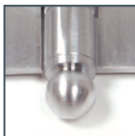
embout boule ball tip