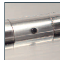
vis de sécurité grab screw