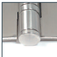
embout plat flat tip